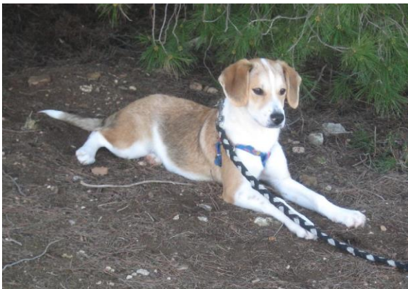
Es war Liebe auf den ersten Blick.

Dies war eins der ersten Bilder von Dir, damals noch in Aegina. In Laufe der Jahre bei uns (knapp 14 ½ Jahre) wuchs dein Fotoalbum immer weiter. Aus einem scheuen über alles erschreckende Hundekind wurde ein schöner, wacher und lauffreudiger Gefährte, dankbar für seine Gefährtin Romy (die schwarze Grand Dame).